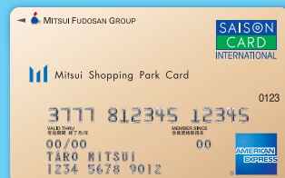
三井ショッピングパークカード《セゾン》