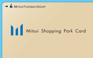
三井ショッピングパークポイントカード

※ラゾーナ川崎プラザポイントカード、ラゾーナ川崎プラザカード 《セゾン》も対象となります。